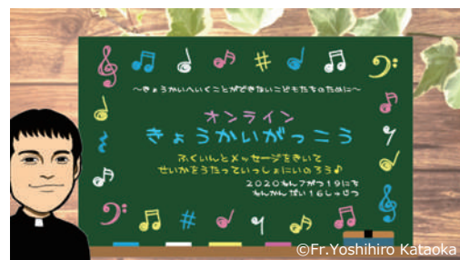
2023 年 4 月 片岡義博神父 (名古屋教区) オンラインきょうかいがっこう