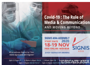
2020 年 11 月 シグニスアジア会議