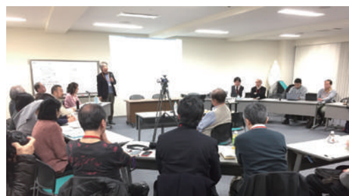
2017 年 2 月 参加者との意見交換

メディアによる宣教の推進もシグニスの活動の柱です。毎年「教会とインターネットセミナー」を開催し、カトリック教会内外からも広く講師を招き、教会 HP の制作や運営、メディアを通して福音を伝えることについて共に考える機会を提供しています。最近では「オンラインで信仰を育む」と題して、オンラインでの教会学校が紹介されました。これまでは対面でのセミナーでしたが、この数年はオンラインを活用し、日本各地から参加されています。