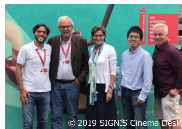
2019 年 ヴェネチア国際映画祭