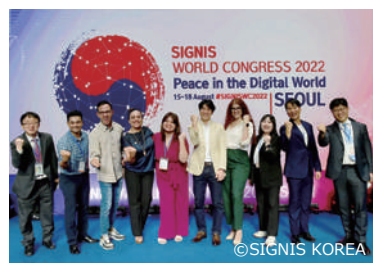
2022 年 8 月 シグニス世界大会 右は日本からの参加者

シグニスは世界各地で活動しています。4 年ごとに世界大会があり、各国・地域からメディア、ジャーナリズムに関する問題や課題が発表されます。2022 年には韓国・ソウルで開催されました。日本からは現地に 3 名が参加すると共に、オンラインブースを出展しました。また毎年アジアの仲間が集まりアジア会議を開催しています。シグニスワールド/アジアによる広報、ジャーナリストのための研修の機会も設けられ、世界各地から若者が積極的に参加してこれからの発展が期待されます。この他、映画の分野では国際映画祭シグニス賞に日本からも審査員が加わって世界のシグニスとつながっています。